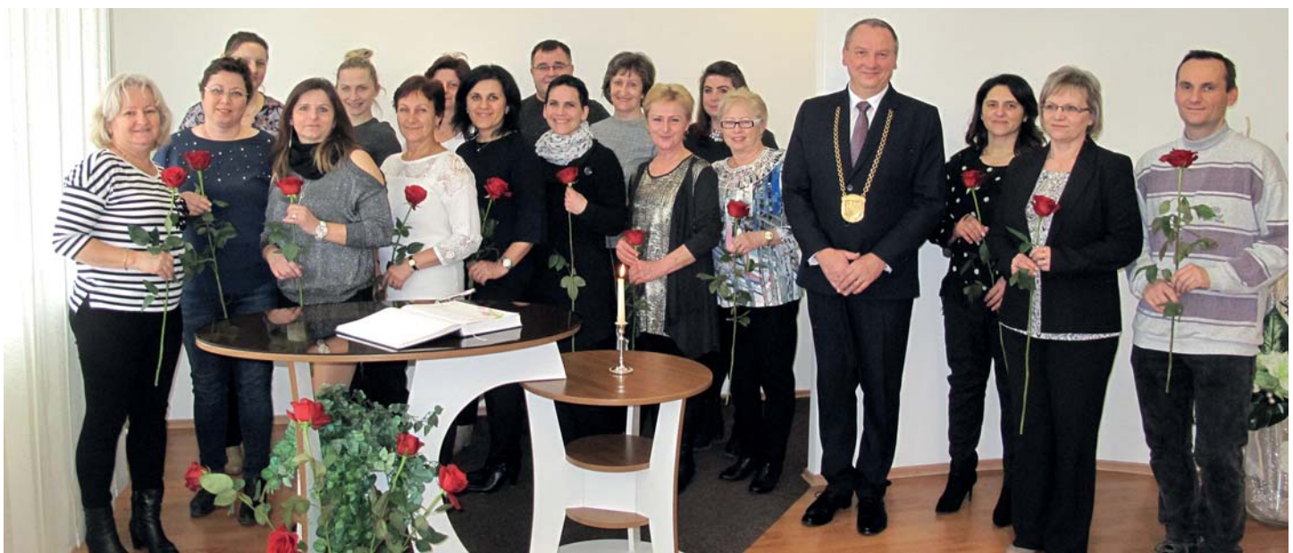
Deň učiteľov a slávnostné prijatie u starostu obce.