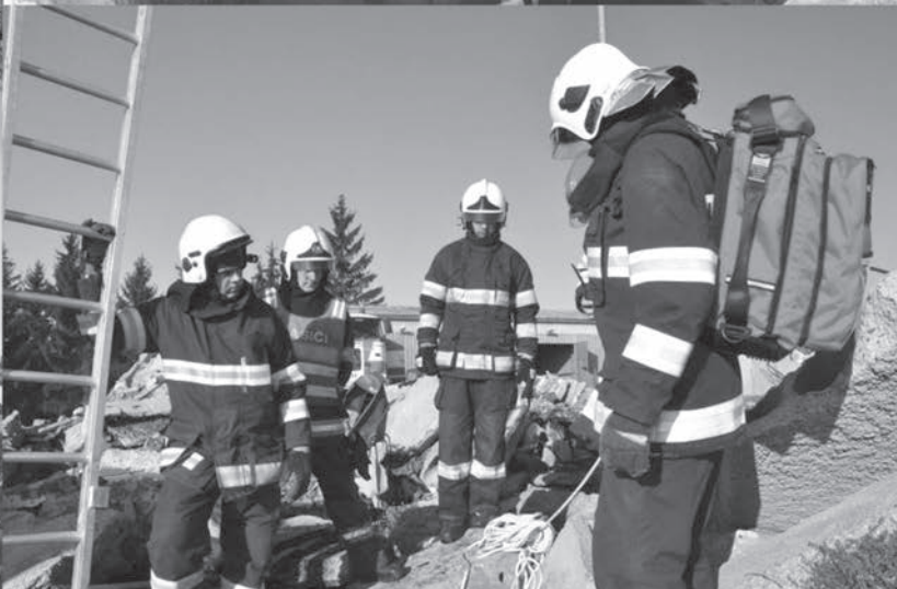
Simulácia nehody v Leteckých opravovniach.