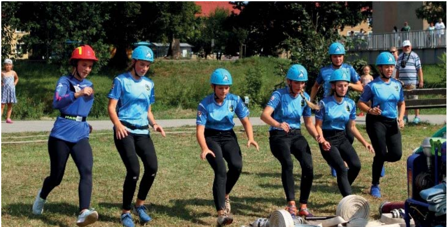
Nočné hasičské súťaže Háj – 2. miesto MT- Priekopa – 7. miesto